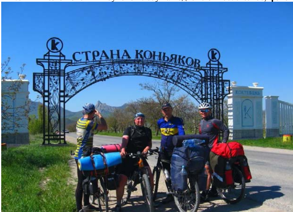
Фото 8 : Коктебель – страна коньяков.