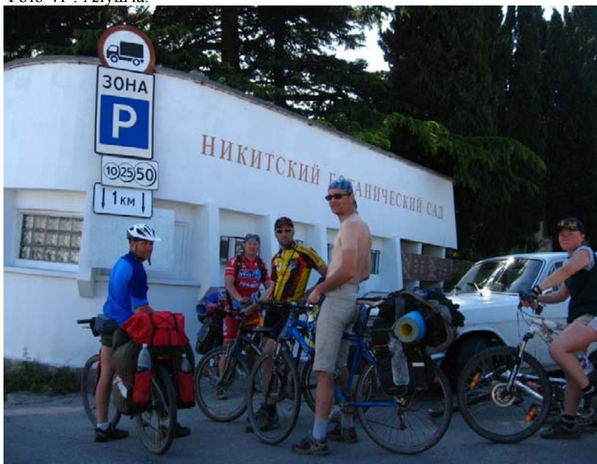
Фото 42 : въезд в Никитский бот. Сад.