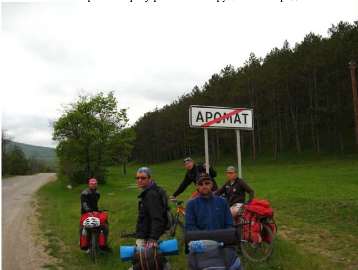
Фото 50 : пос. Аромат.