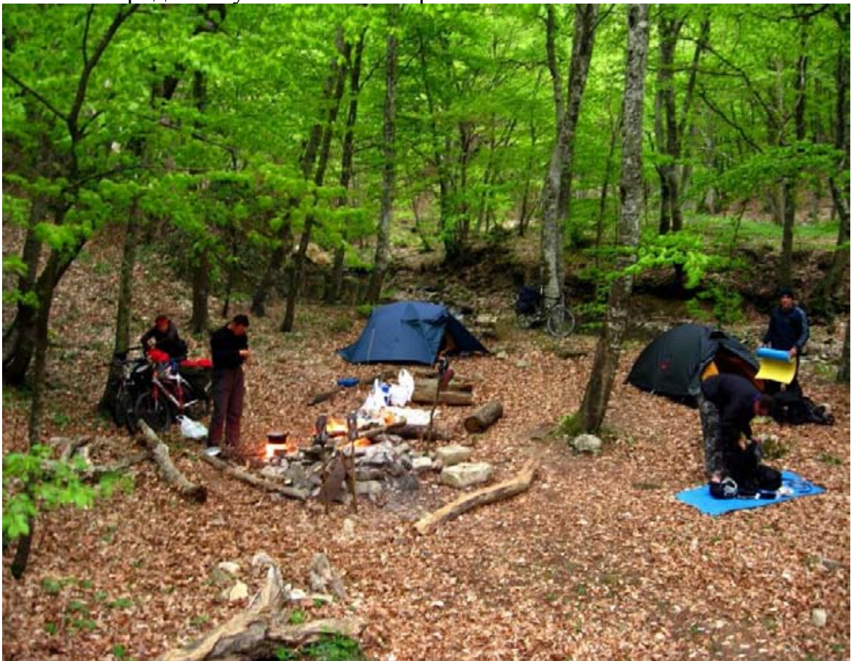
Фото 23 : место ночёвки на спуске в пос. Поворотное.