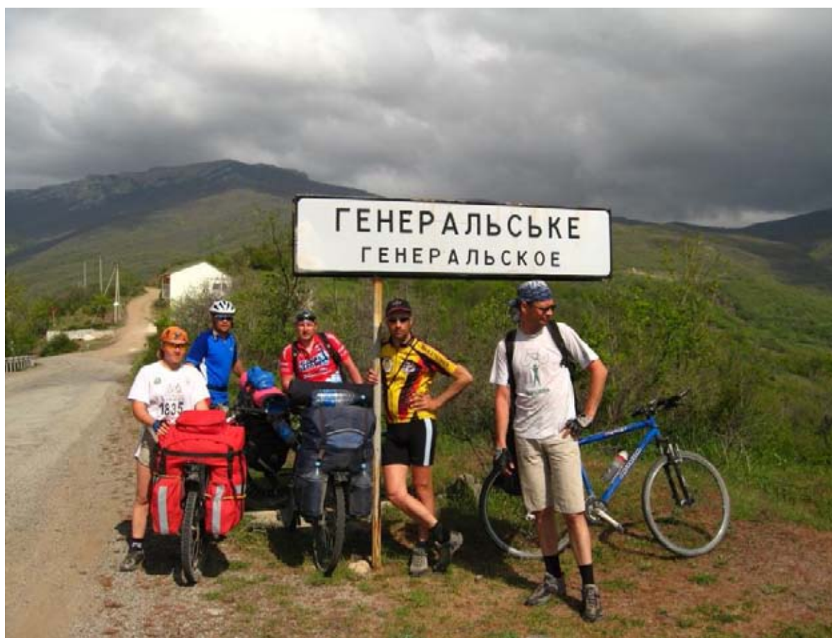
Фото 32 : пос. Генеральское.