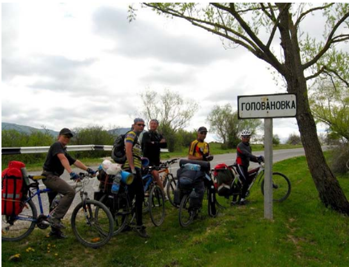
Фото 27 : пос. Головановка.