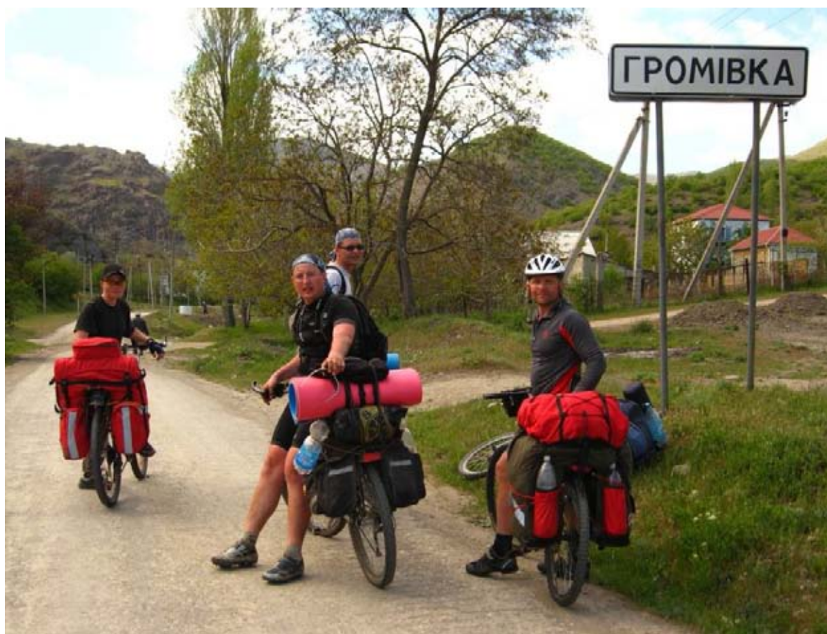
Фото 18 : пос. Громовка