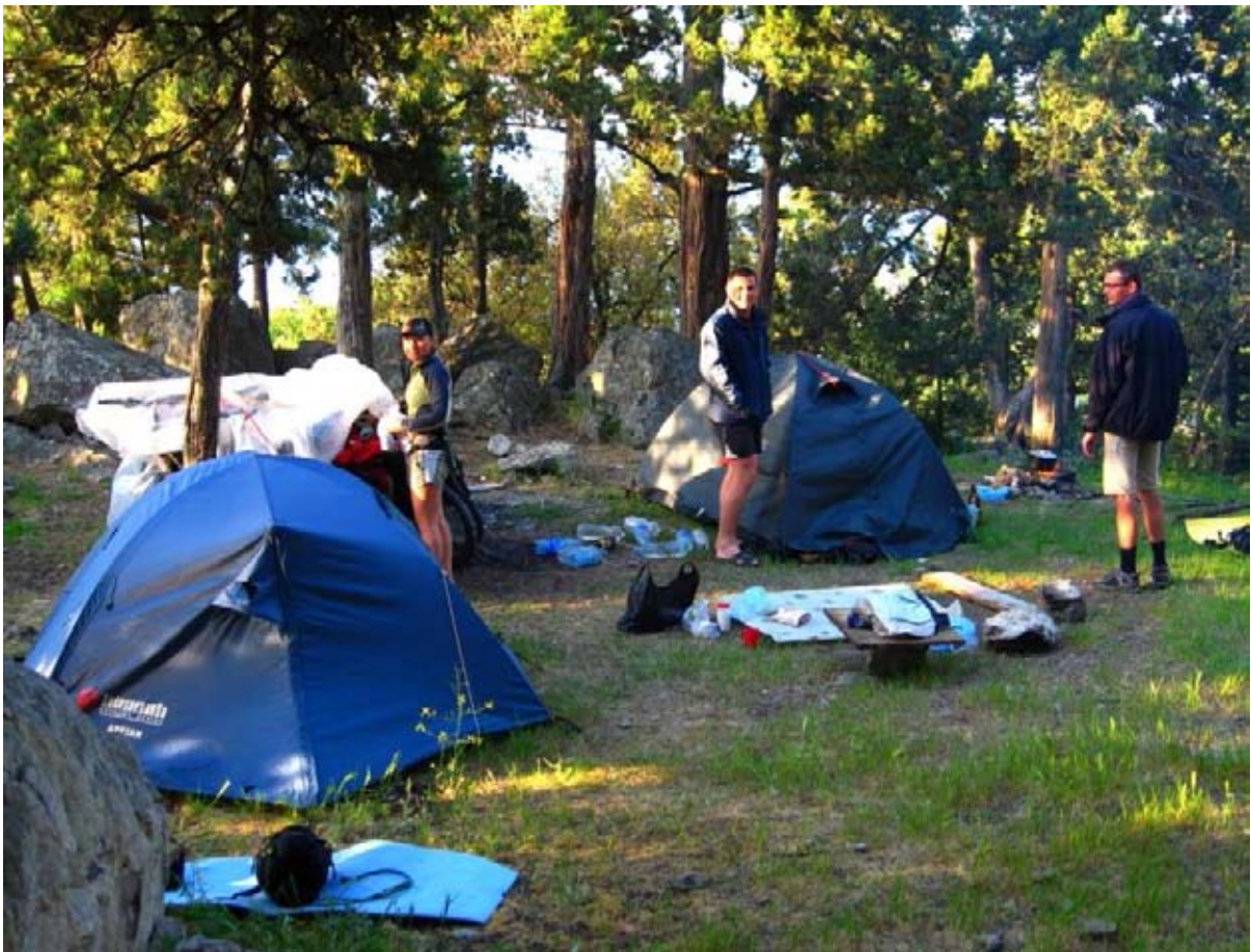
Фото 44 : место ночёвки и днёвки на Крестовой горе.