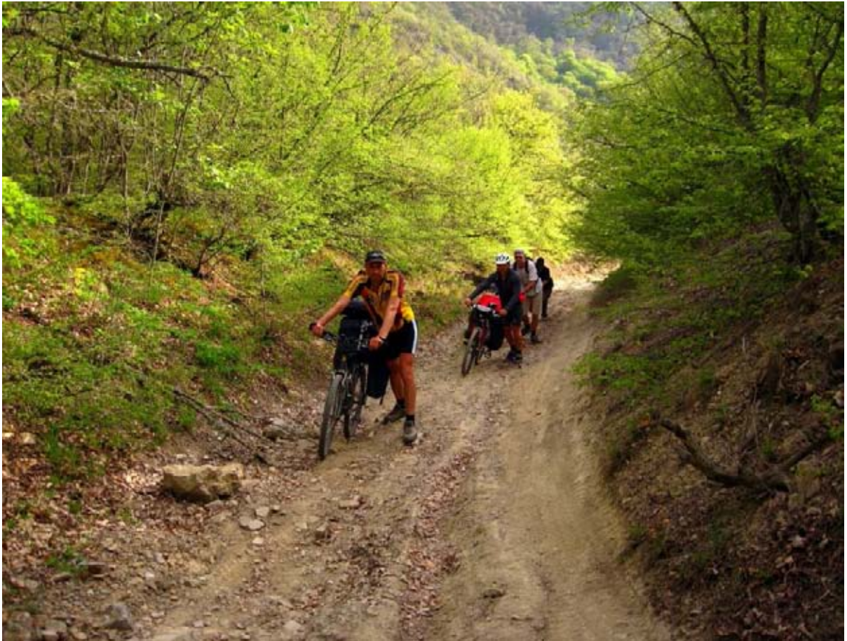
Фото 20 : участок подъёма на пер. Н. Шеленский.