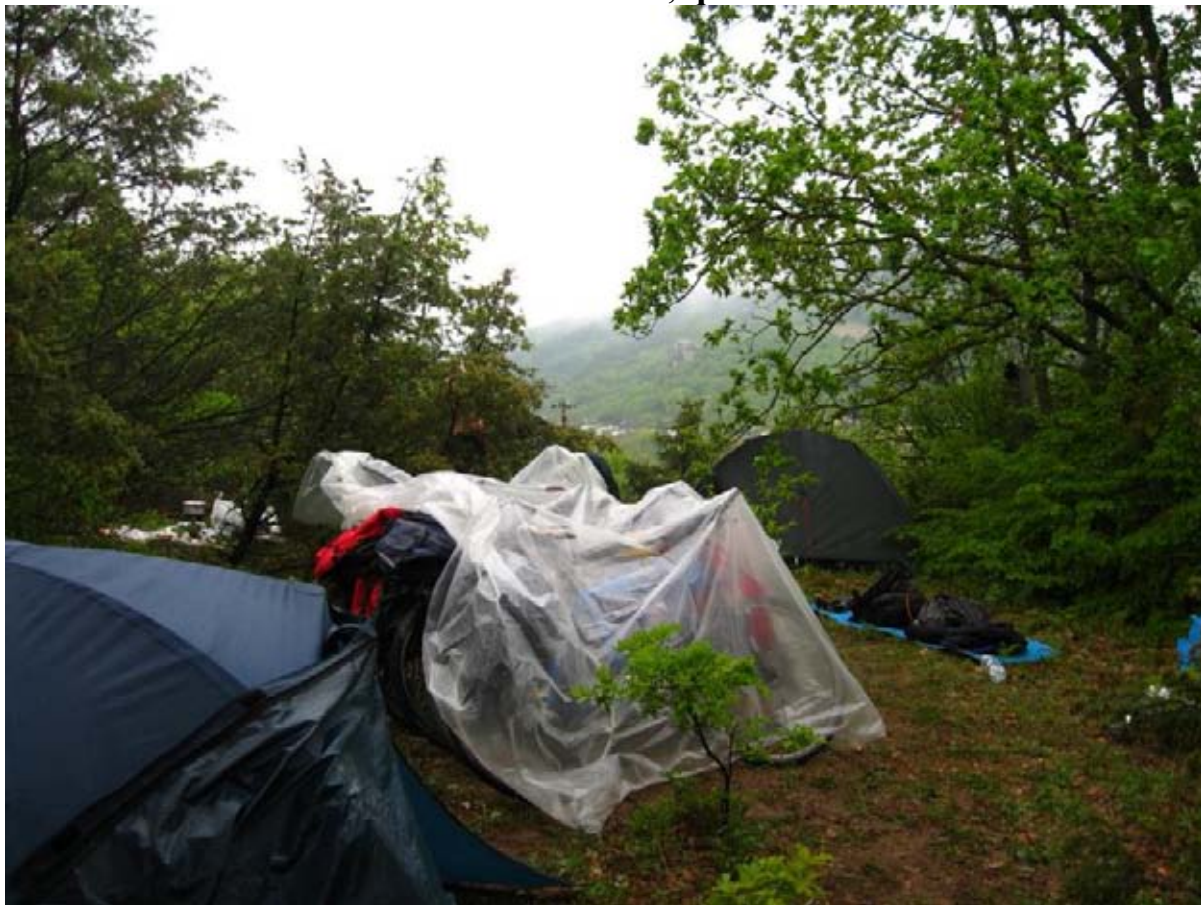
Фото 55 : место ночёвки за пос. Залесное.

573.4км – место ночёвки за пос. Залесное, фото 55 .