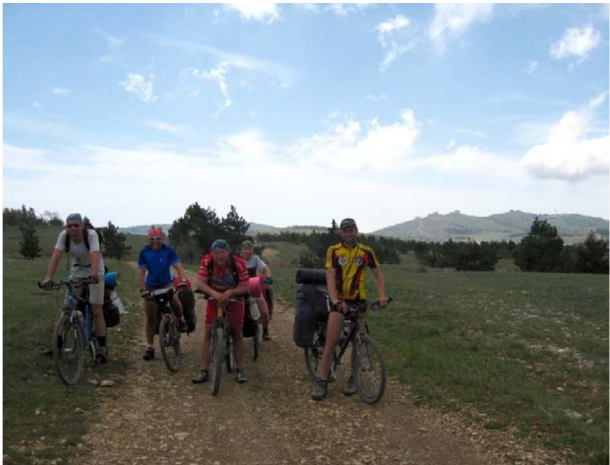
Фото 46 : участок дороги по Ай-Петринской яйле, в дали видны «грибы» обсерватории.