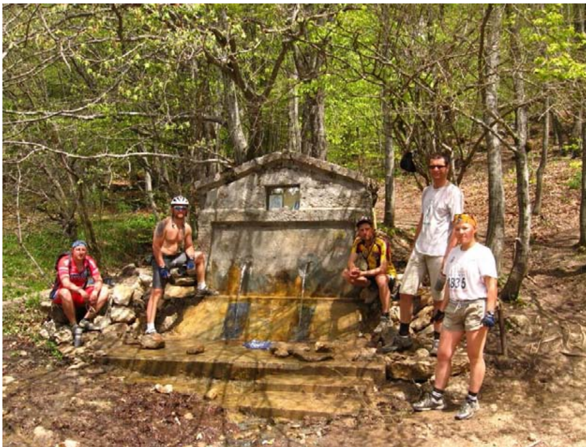
Фото 34 : родник «Ай-Алексий».