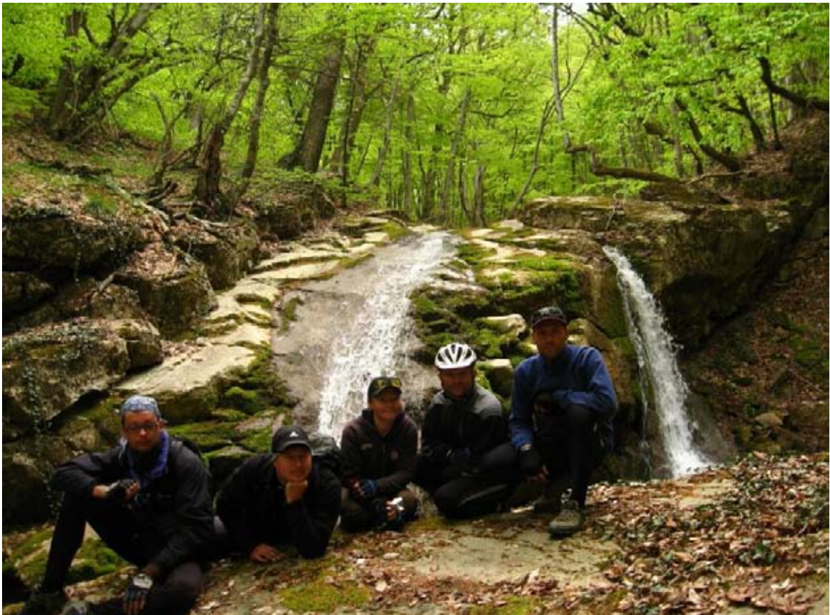
Фото 24 : водопад возле места ночёвки на спуске с пер. Н. Шеленский. 288.3км – пос. Поворотное, фото 25.