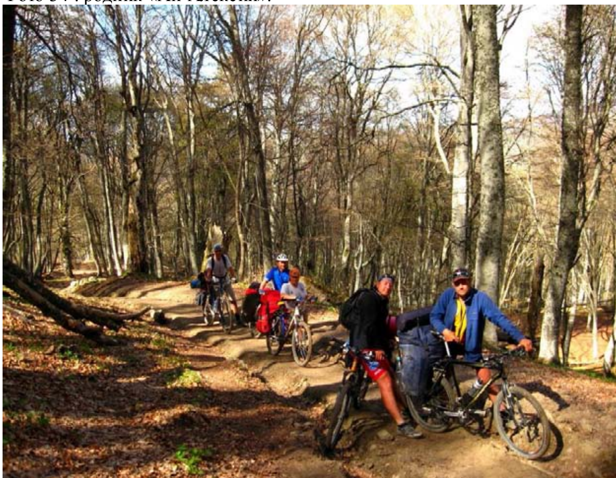
Фото 35 : участок подъёма на г. Стол, ближе к т/с «Вост. Суат».