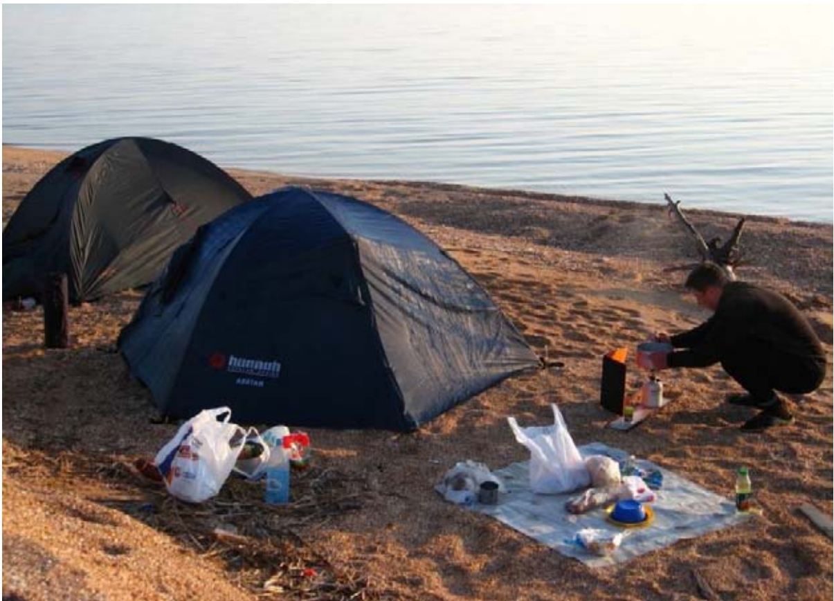
Фото 2 : место ночёвки на берегу Азовского моря.