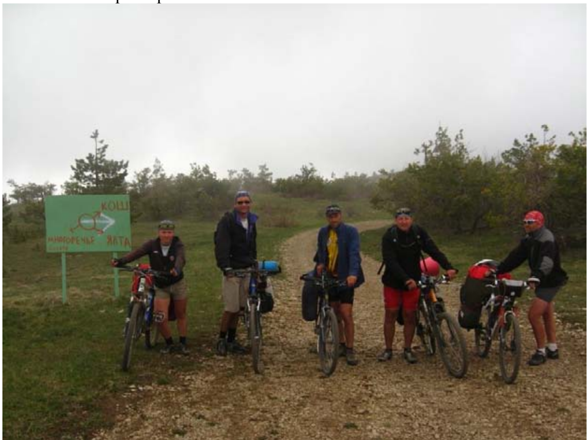
Фото 47 : развилка дорог на сев. оконечности Ай-Петринской яйлы.