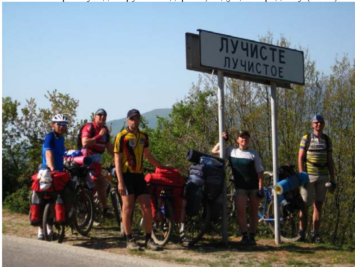
Фото 40 : пос. Лучистое.

396.0км – вправо уходит грунтовая дорога , ведущая к роднику (100м).