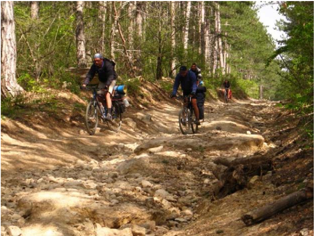
Фото 48 : участок дороги размытой ручьями на спуске с Ай-Петринской яйлы в пос. Многогоречье.