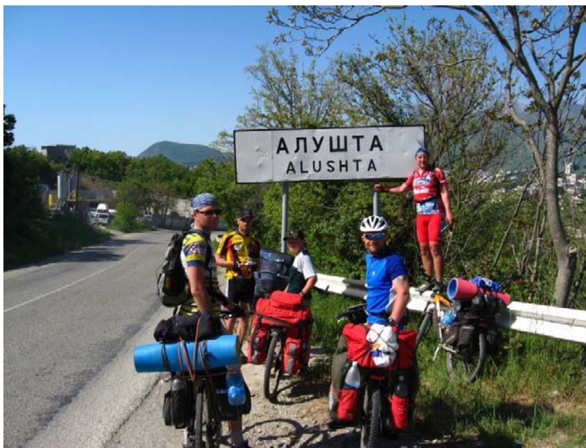
Фото 41 : Алушта.