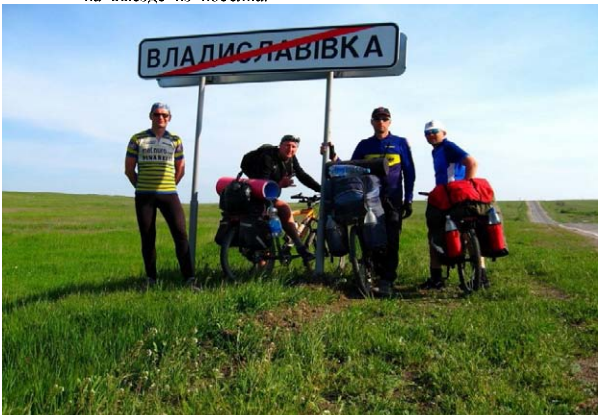
Фото 4 : пос. Владиславовка.

162.1км – пос. Владиславовка, ж/д вокзал, начало асфальта, фото 4 , указатель на выезде из посёлка.