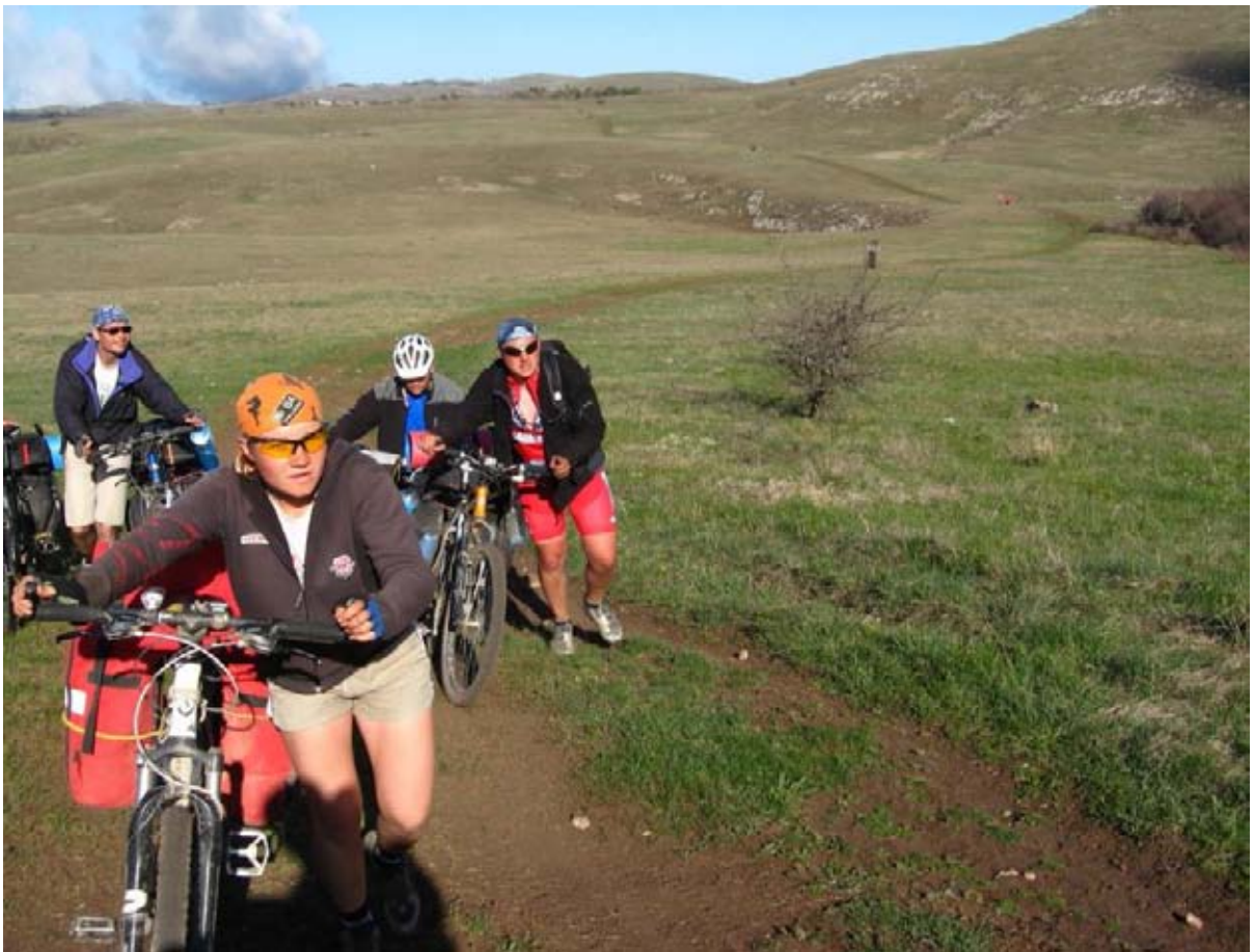
Фото 38 : участок дороги по плато Сев. Демерджи.