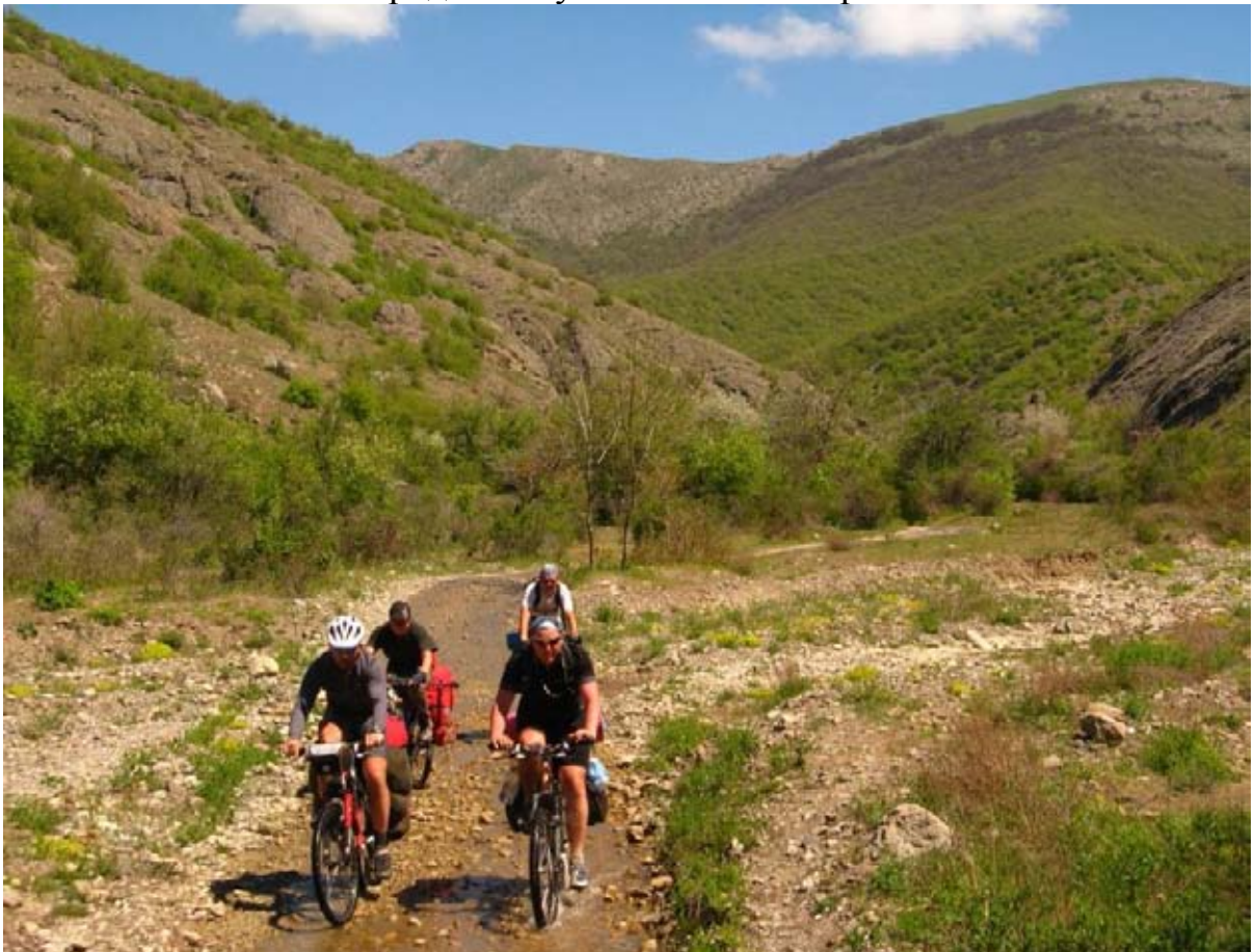
Фото 15 : речка течёт прямо по дороге, спуск в пос. Межречье.