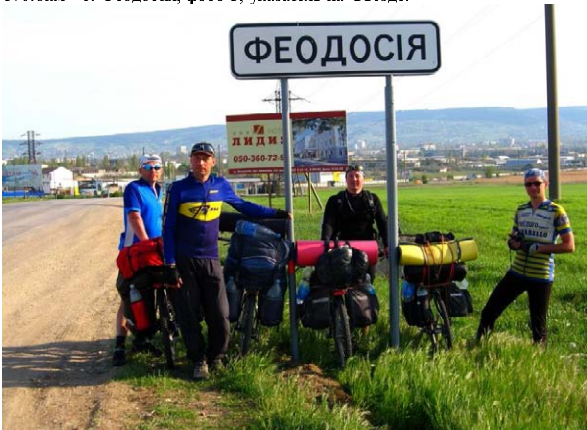
Фото 5 : г. Феодосия.

170.8км – г. Феодосия, фото 5 , указатель на въезде.