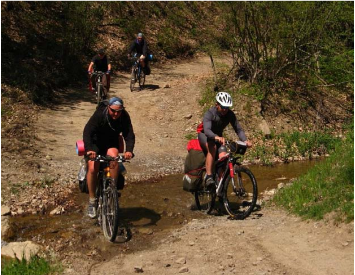
Фото 14 : Небольшой брод на спуске в пос. Межречье.