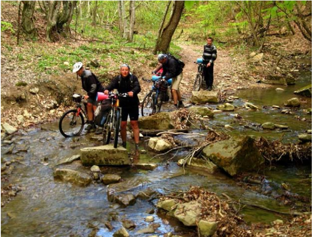
Фото 22 : брод на спуске в пос. Поворотное.