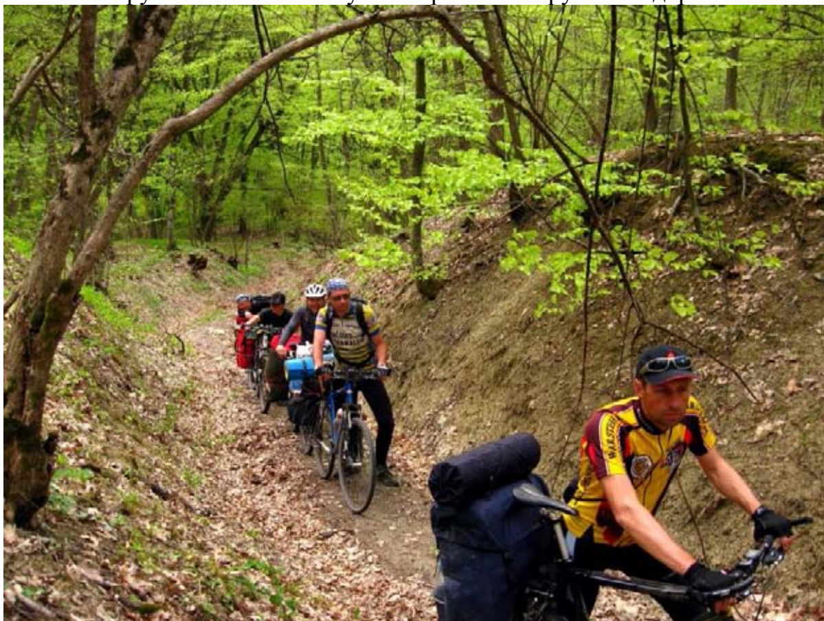
Фото 26 : участок подъёма от пос. Поворотное в пос. Алексеевка.

288.6км – поворот на Алексеевку, начинается затяжной (2-х км) крутой подъём (до 20 – 25 %), дорога грунтовая, лесная, используется очень редко, местами просто заросла травой, очень часто идём пешком, фото 26 , за перевалом начинается короткий, но очень крутой и опасный спуск по размытой ручьями дороге.