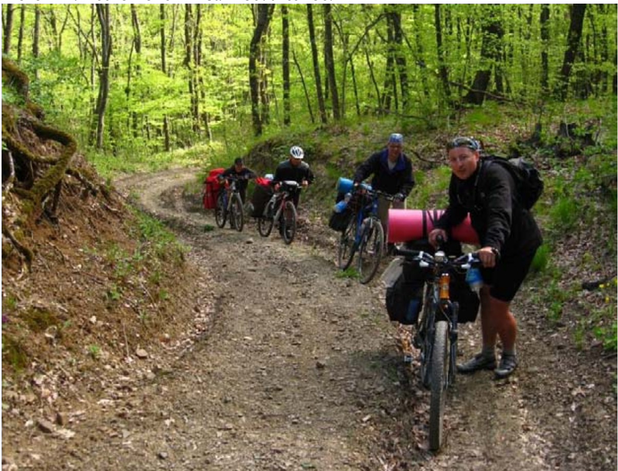
Фото 12 : участок подъёма от места ночёвки к хр. Хамбал.