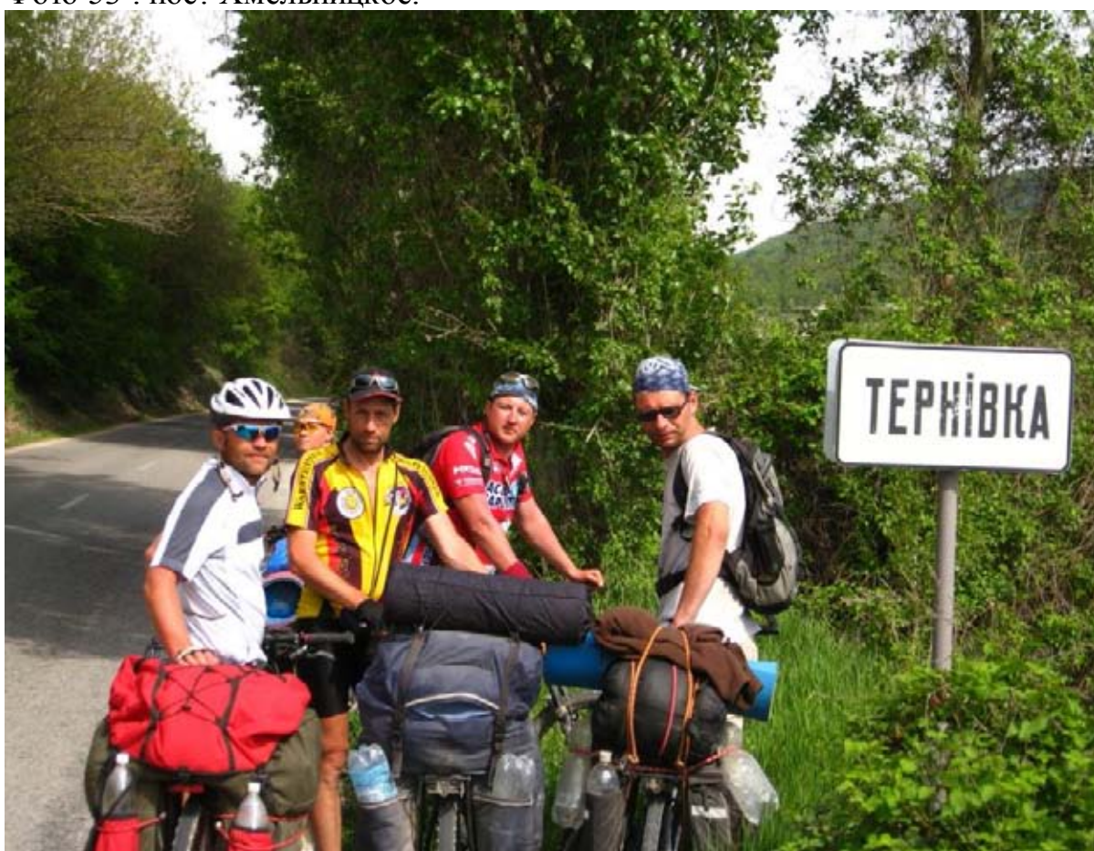
Фото 54 : пос. Терновка.