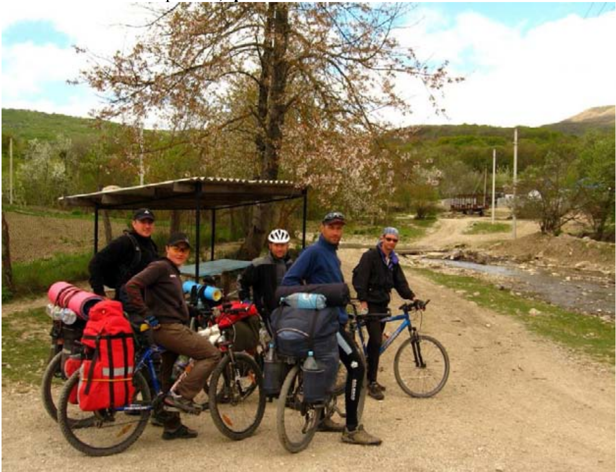
Фото 25 : пос. Поворотное.