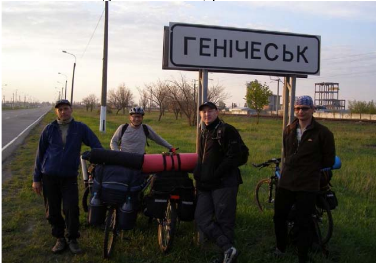
Фото 1 : г. Геническ.

10.2км – г. Геническ, указатель на въезде, фото 1 .