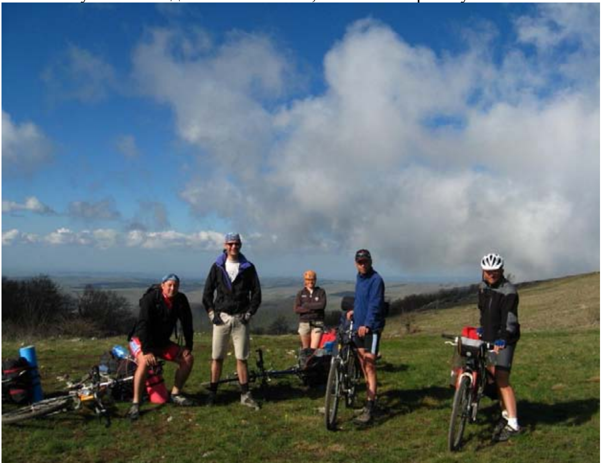
Фото 37 : пер. на г. Стол ( 1135м ), вдали видно плато Караби-Яйла.