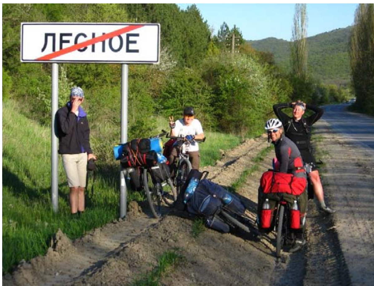
Фото 9 : пос. Лесное.