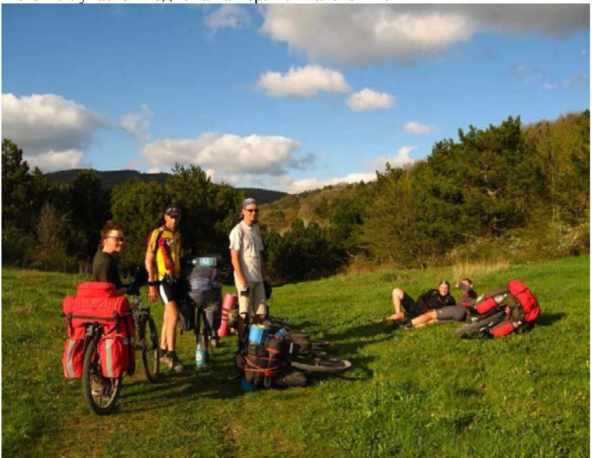
Фото 21 : пер. Н. Шеленский (665м).