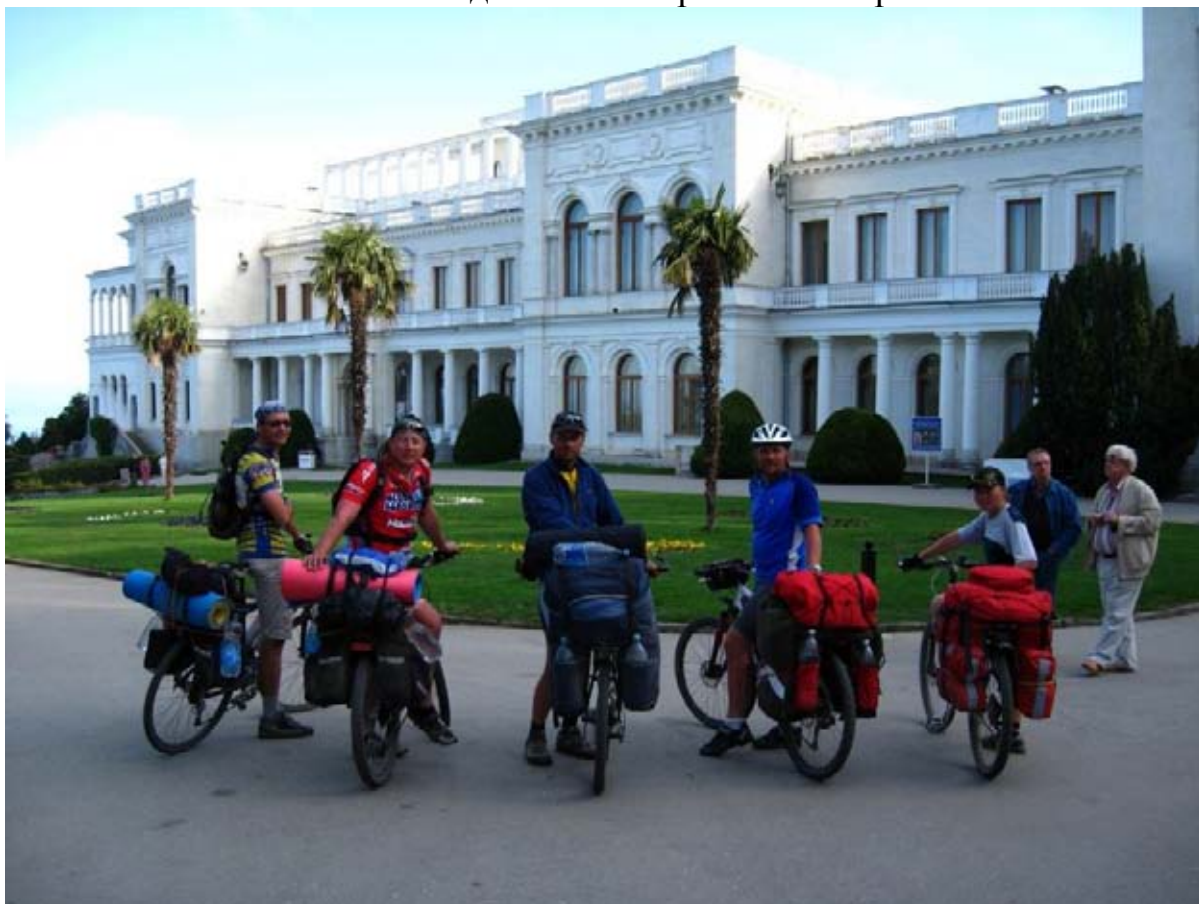
Фото 43 : группа на фоне Ливадийского дворца.

451.2км – место ночёвки и днёвки на Крестовой горе.