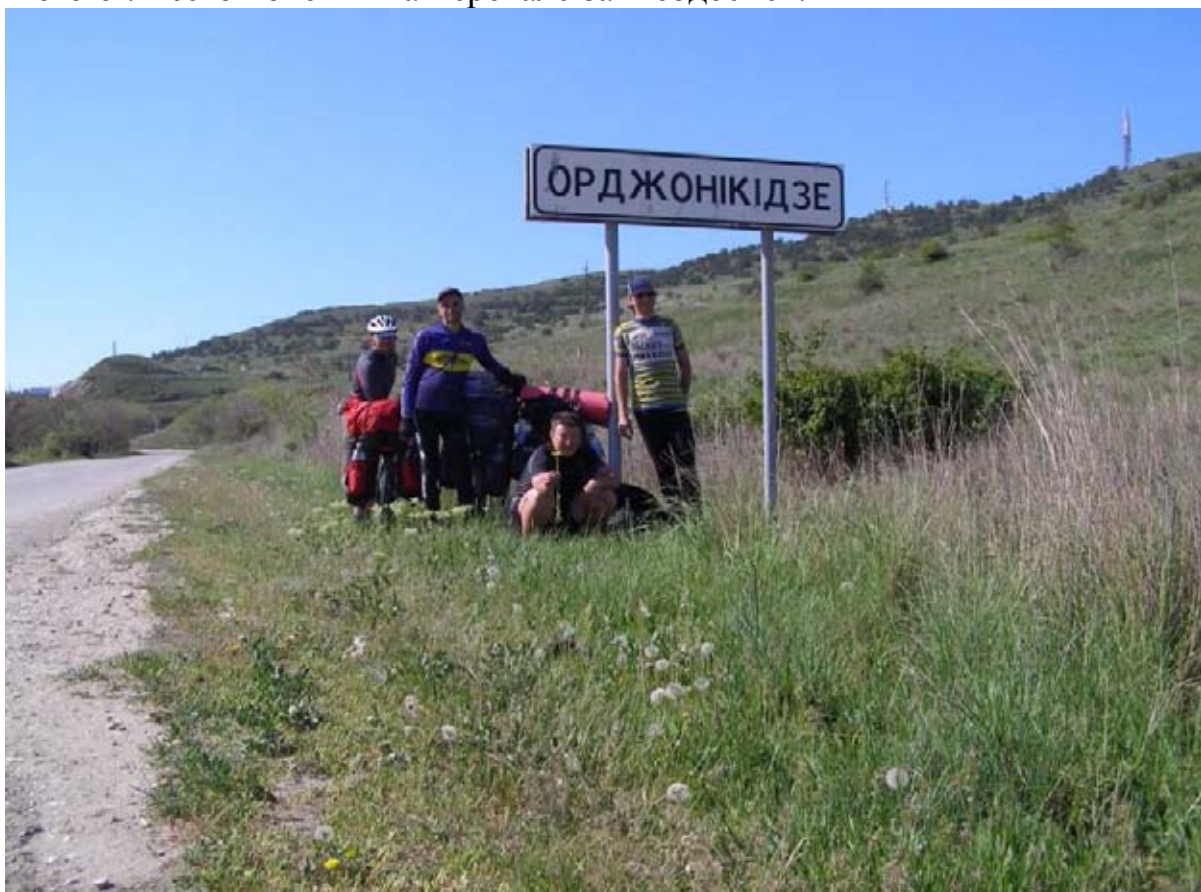
Фото 7 : Орджоникидзе.