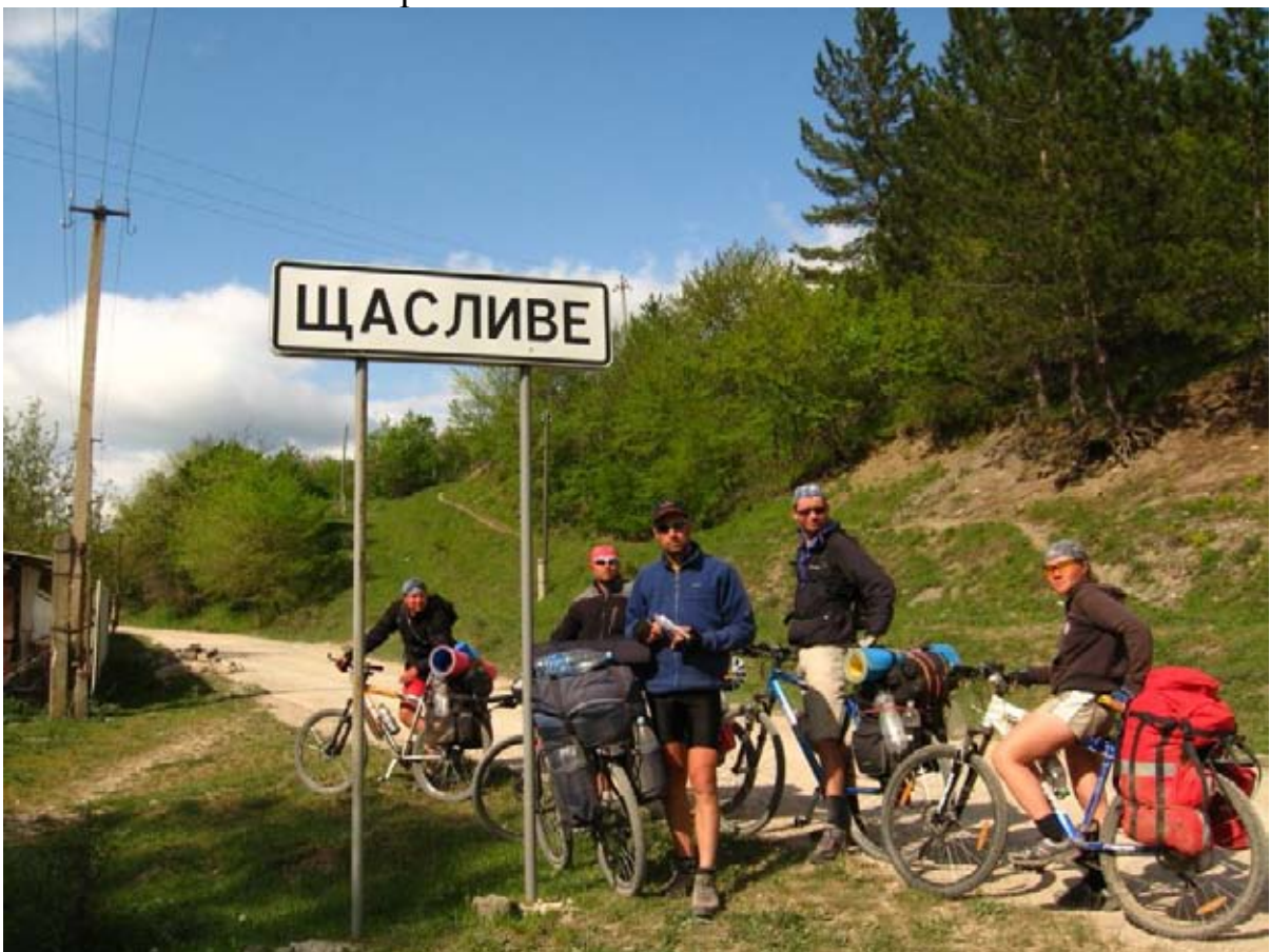
Фото 49 : пос. Счастливое.