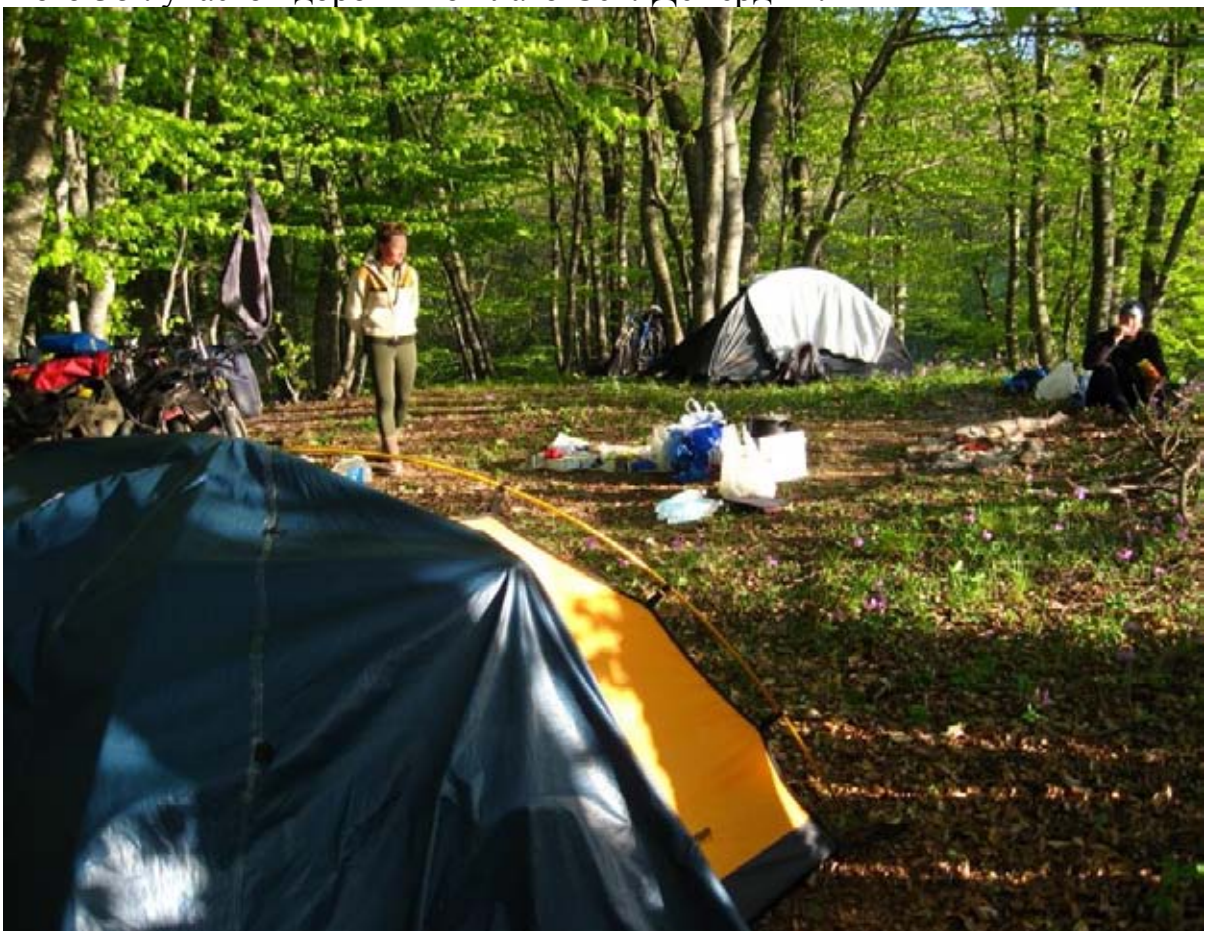
Фото 39 : место ночёвки перед пос. Лучистое.