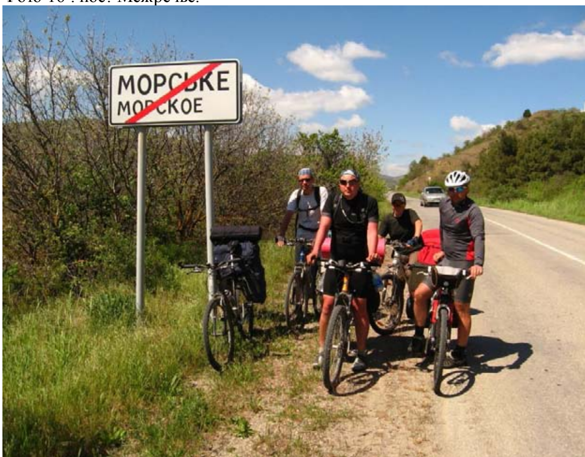
Фото 17 : пос. Морское.