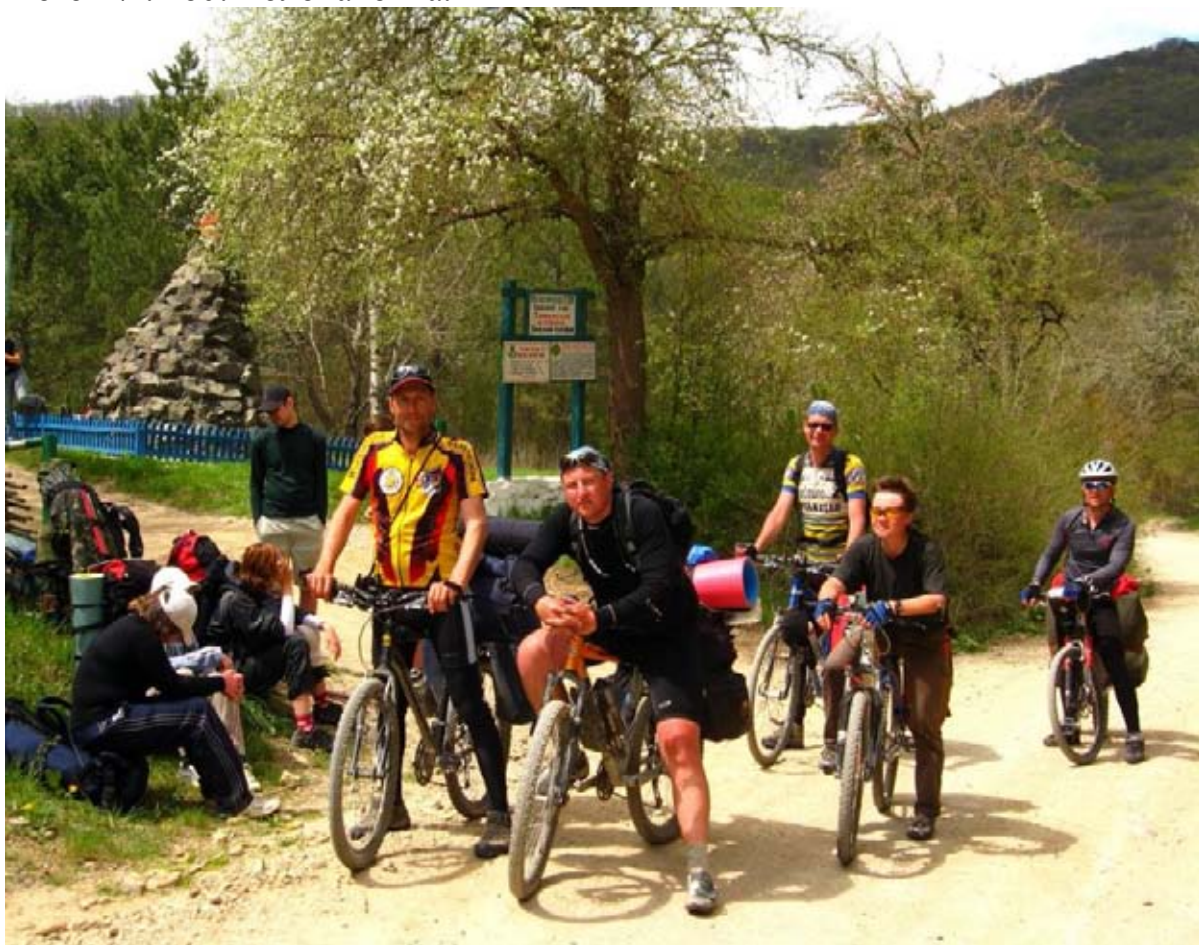
Фото 28 : памятник партизанам на т/с «Нижний Кокасан».