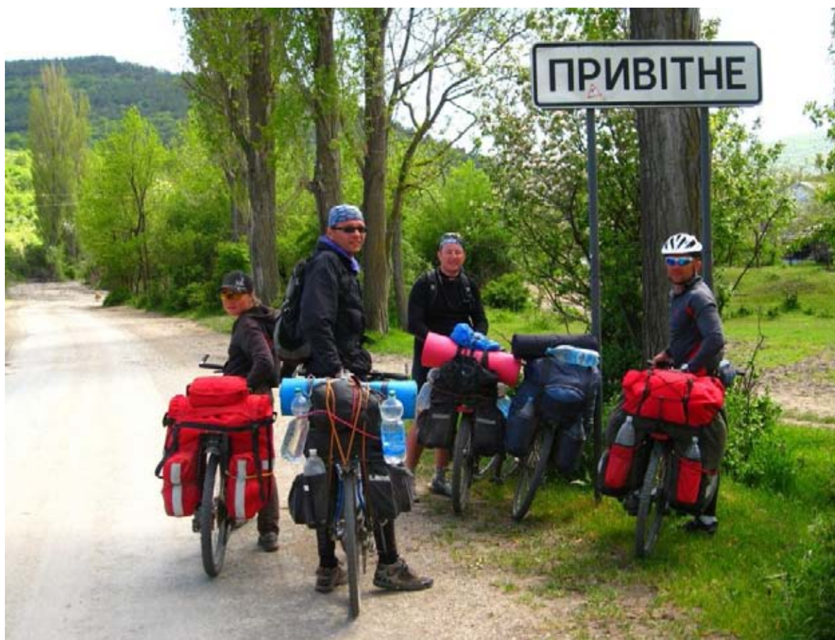
Фото 29 : пос. Приветное.