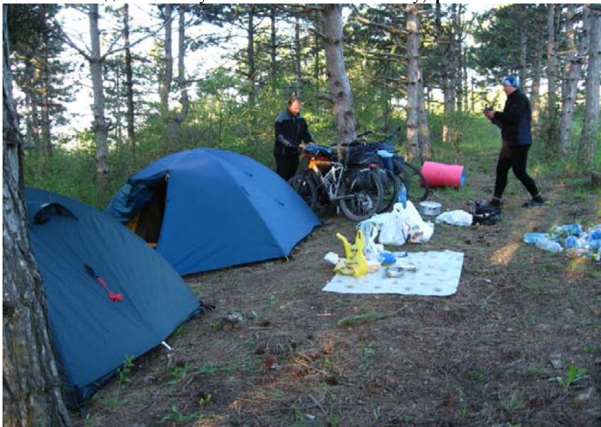
Фото 6 : место ночёвки на перевале за Феодосией.

185.4км – пер. 280м , влево уходит грунтовая дорога, мы сворачиваем на неё и едем к месту ночёвки в сосновом лесу, фото 6.