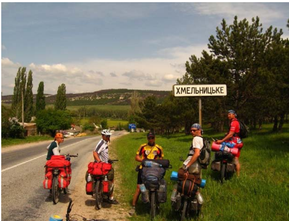
Фото 53 : пос. Хмельницькое.