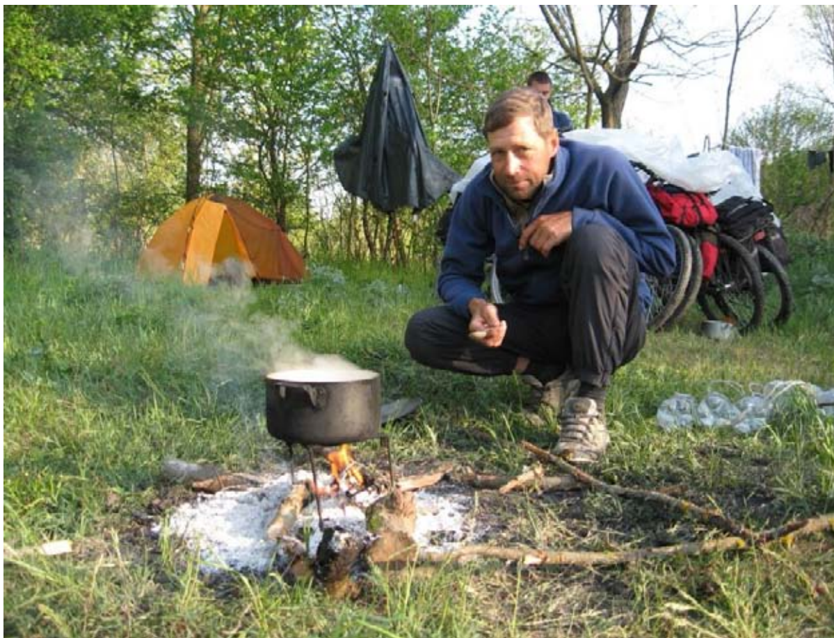
Фото 51 : Ночёвка за Ароматом, готовим завтрак.