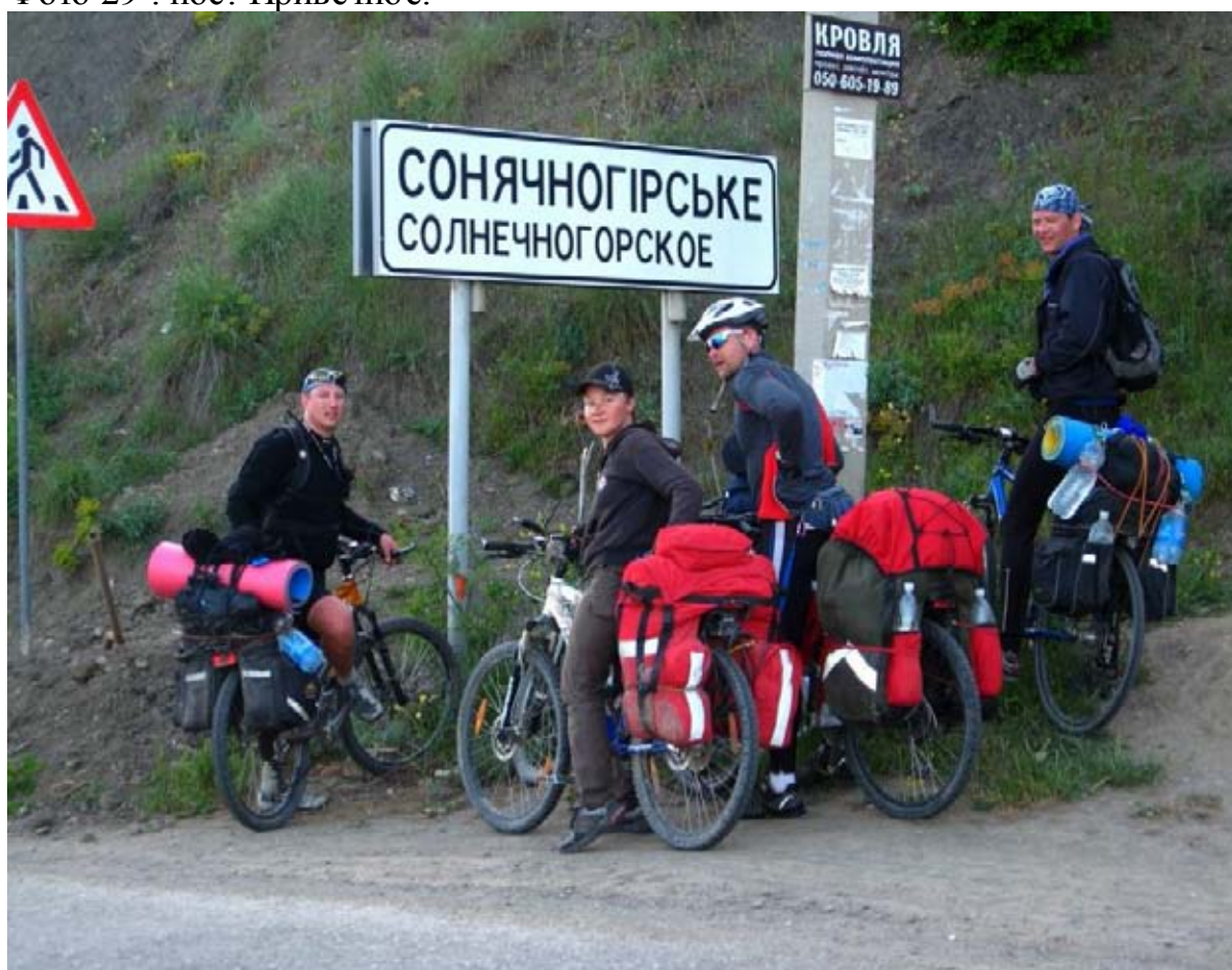
Фото 30 : пос. Солнечногорское.