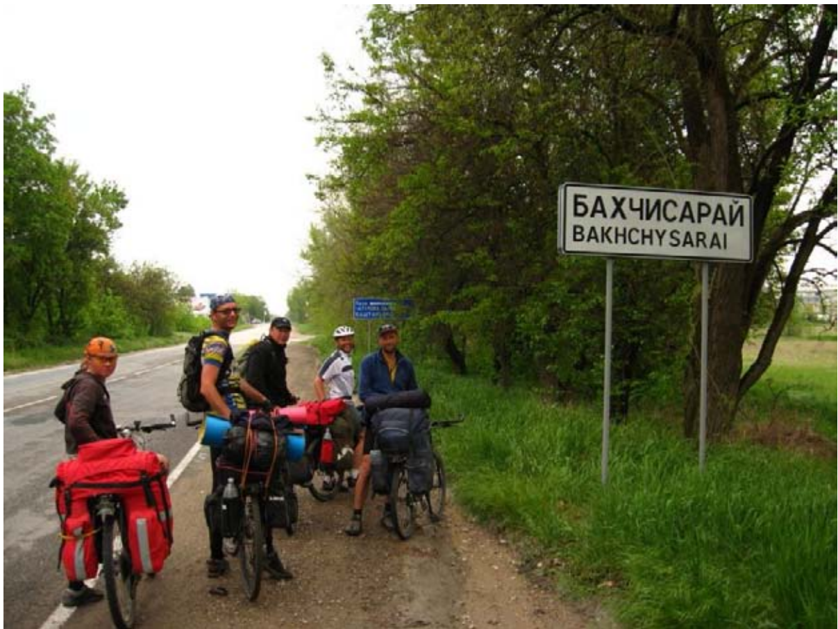
Фото 56 : Бахчисарай.

592.0км – ж/д вокзал в г. Бахчисарай, окончание маршрута. Далее электричкой в Симферополь.