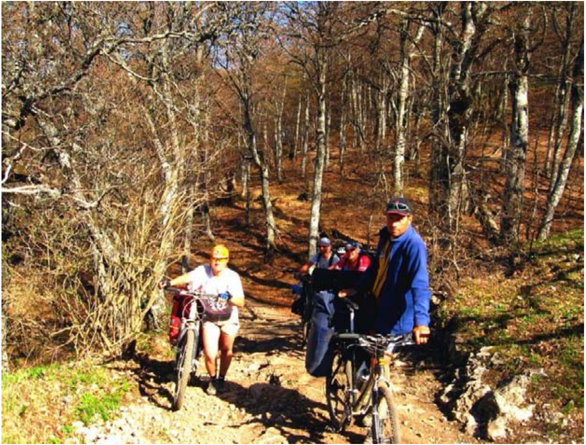
Фото 36 : участок подъёма на г. Стол, ближе к перевалу.