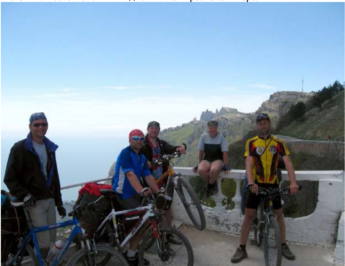
Фото 45 : пер. Ай-Петринский (1176м), вдали видна г. Ай-Петри.