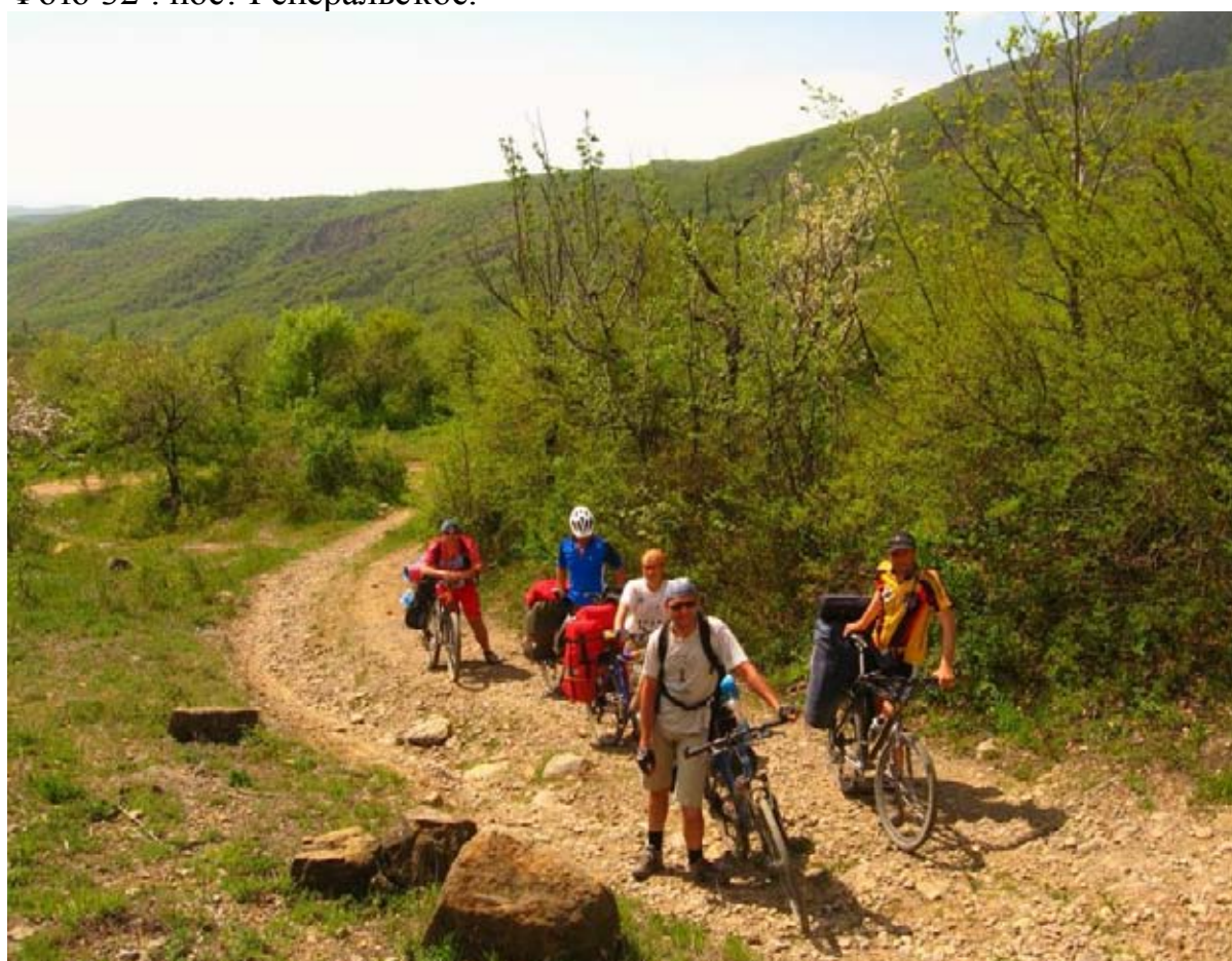
Фото 33 : участок дороги от пос. Генеральское до т/с «Ай-Алексий».