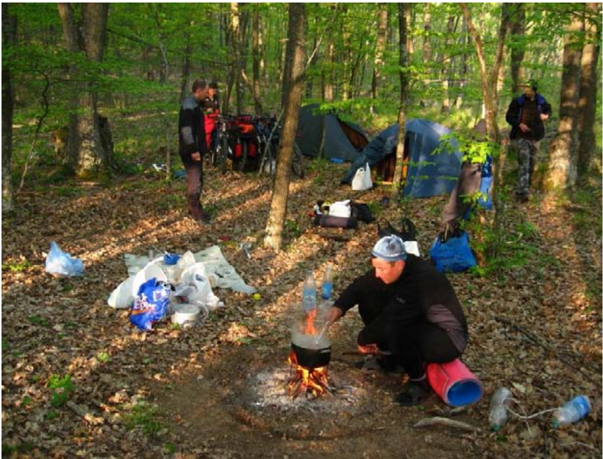
Фото 11 : место ночёвки за пос. Лесное.