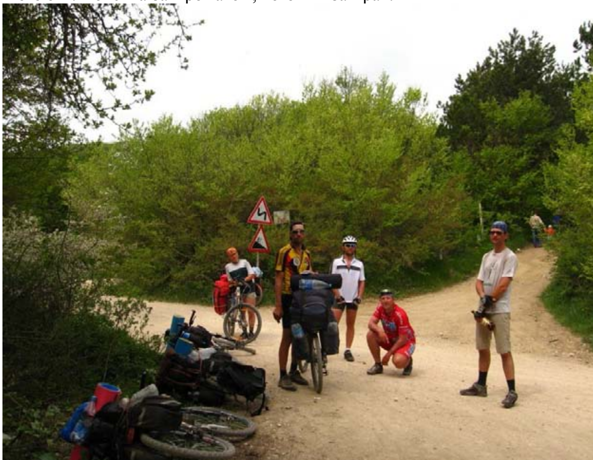
Фото 52 : пер. Бечку ( 725м ).