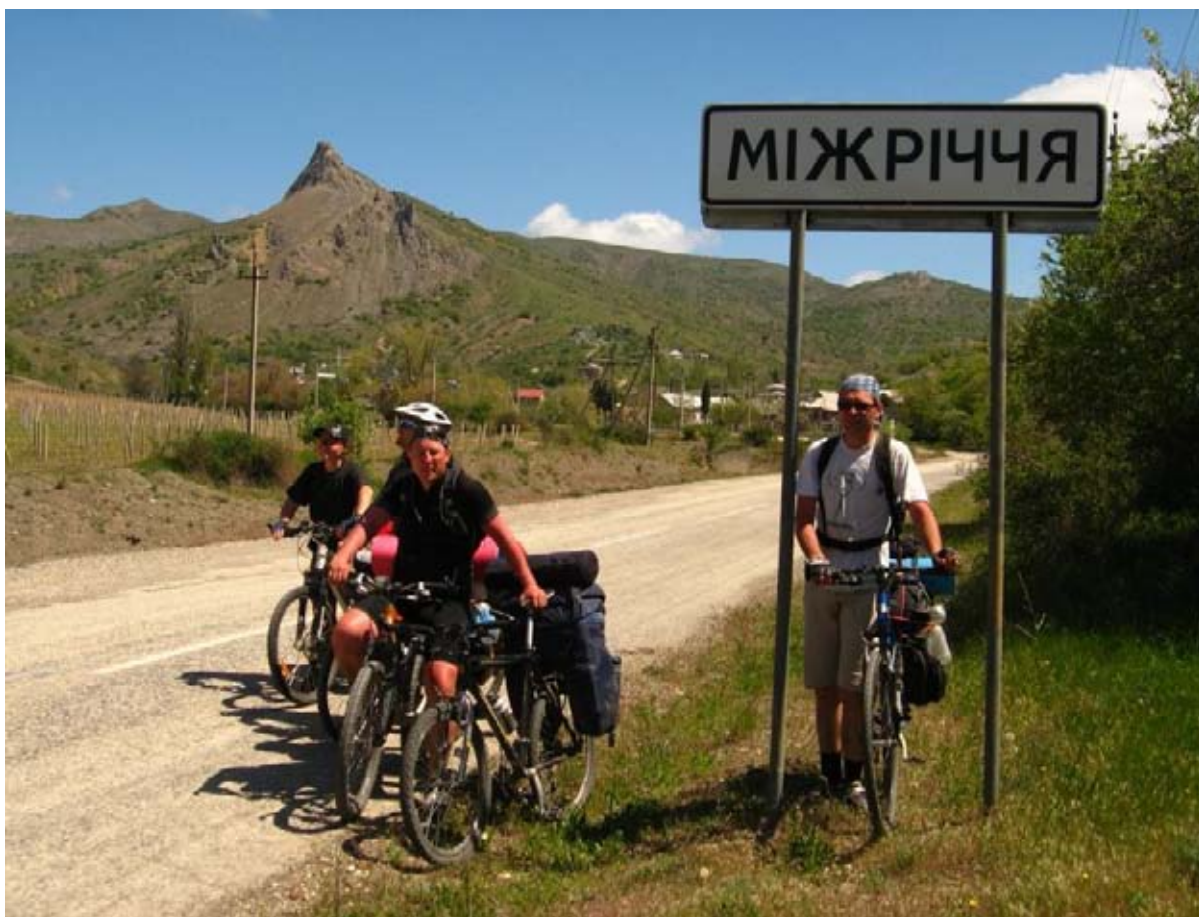
Фото 16 : пос. Межречье.