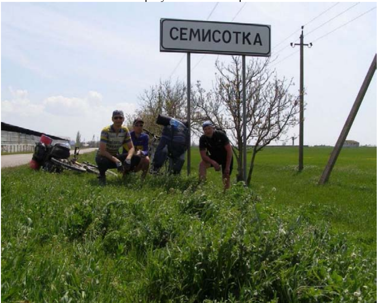
Фото 3 : пос. Семисотка.