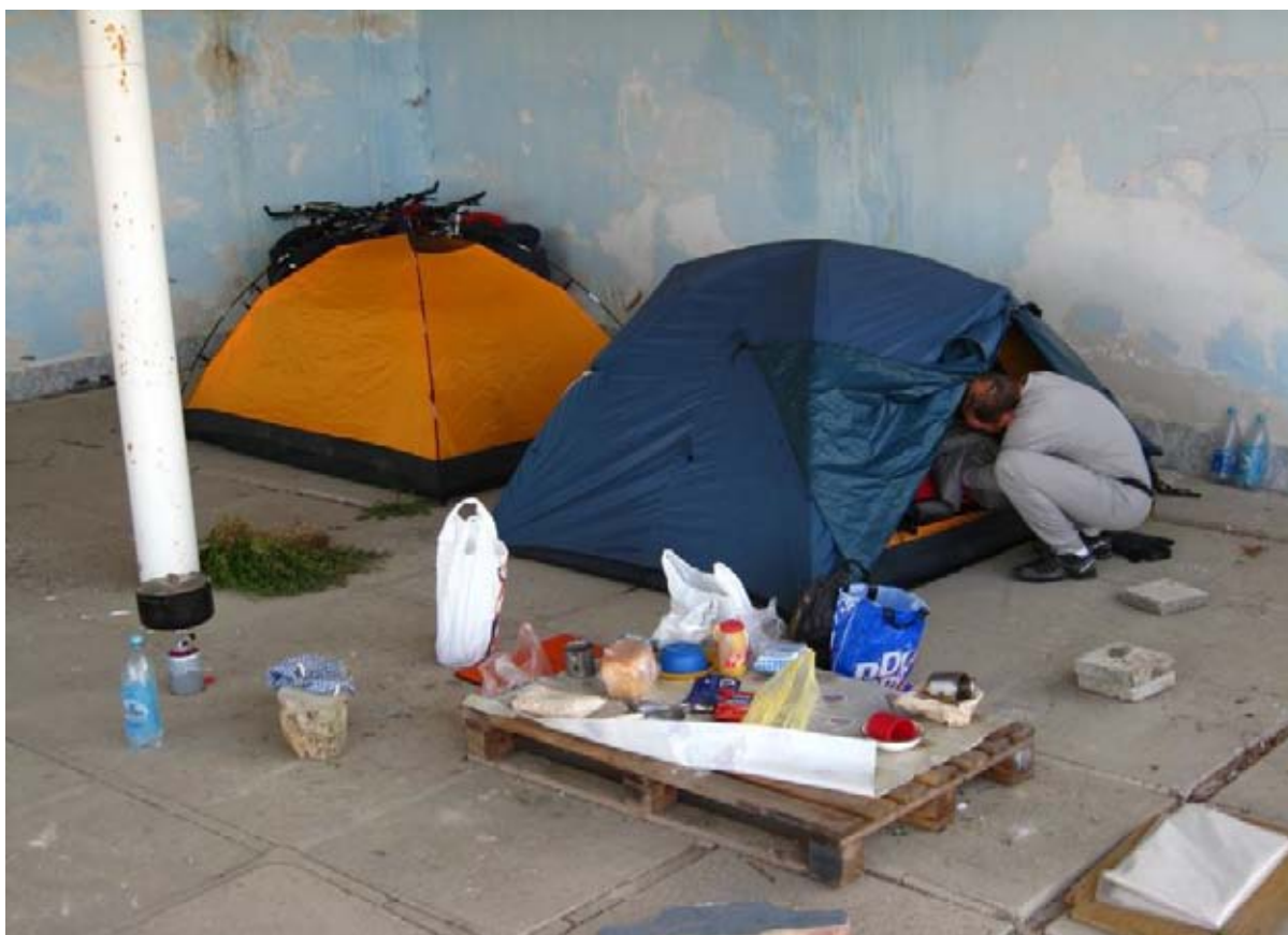
Фото 31 : место ночёвки перед пос. Солнечногорское.